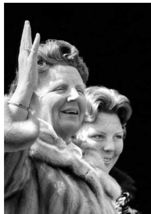
KONINGIN JULIANA EN PRINSES BEATRIX TIJDENS HET DEFILÉ OP PALEIS SOESTDIJK, KONINGINNEDAG 1960.