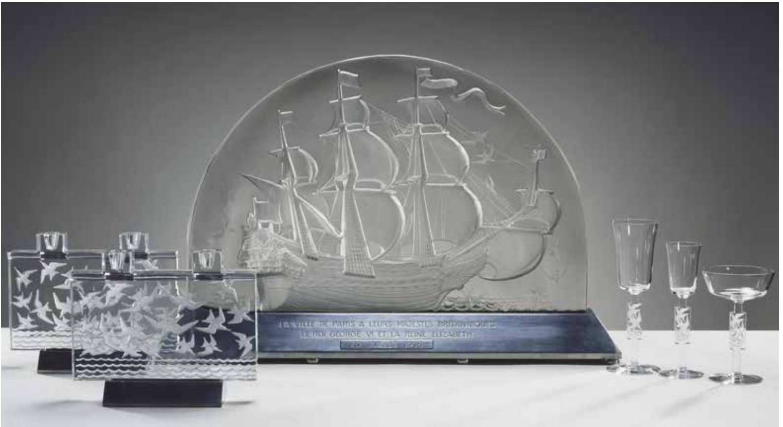
SURTOUT DE TABLE CARAVELLE MET KANDELABERS EN GLAZEN MOUETTES - RENÉ LALIQUE, 1938.

LINKSBOVEN BROCHE/PENDANT MET LYNX | CHAMPLEVÉ-TECHNIEK | GOUD EN PARELS | RENÉ LALIQUE, CIRCA 1905.