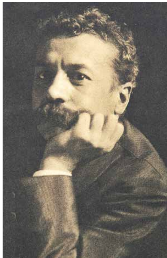
RENÉ LALIQUE (ËY 1860 - PARIJS 1945).

Het zeer kostbare werk van René Lalique geniet van verzamelaars in de hele wereld belangstelling. Niet voor niets wordt de ontwerper ook wel de Da Vinci van de juwelen- en glaskunst genoemd.